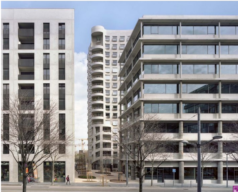
Planifiés par Herzog & de Meuron, les îlots de Lyon Confluence 2 s'organisent autour de passages publics traversants. A droite, le bâtiment de Christian Kerez; au fond, la tour de logements d'Herzog & de Meuron.

L'architecture à RETROUVEZ P 400 DÉTAILS